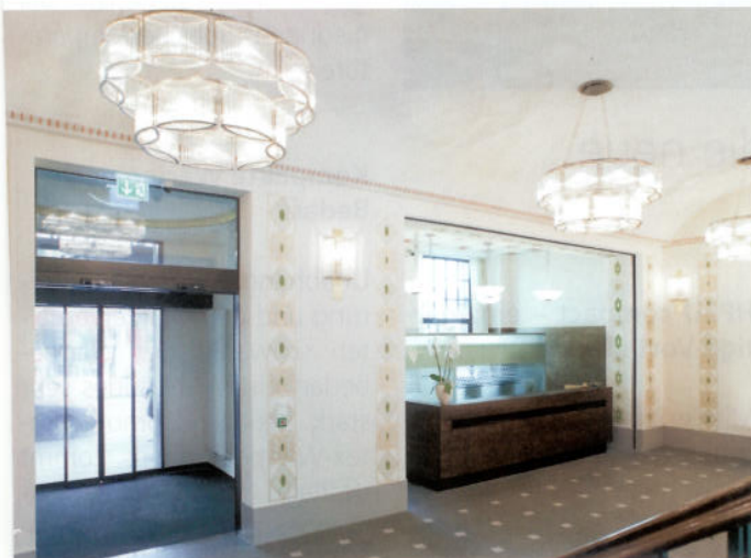
Die neue Lobby im Stil der Belle Époque