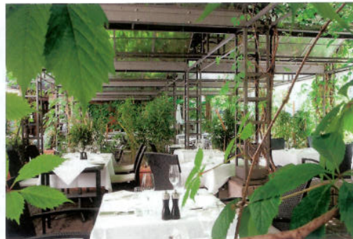
Im Herzen von Zürich – der schöne Garten entzückt die Gäste aus Nah und Fern